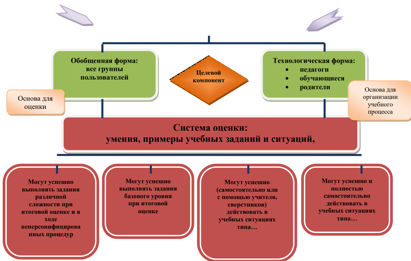
Рис. 1. Особенности структуры планируемых результатов. Функция и назначение.

Система оценки достижения планируемых результатов освоения основной образовательной программы основного общего образования: