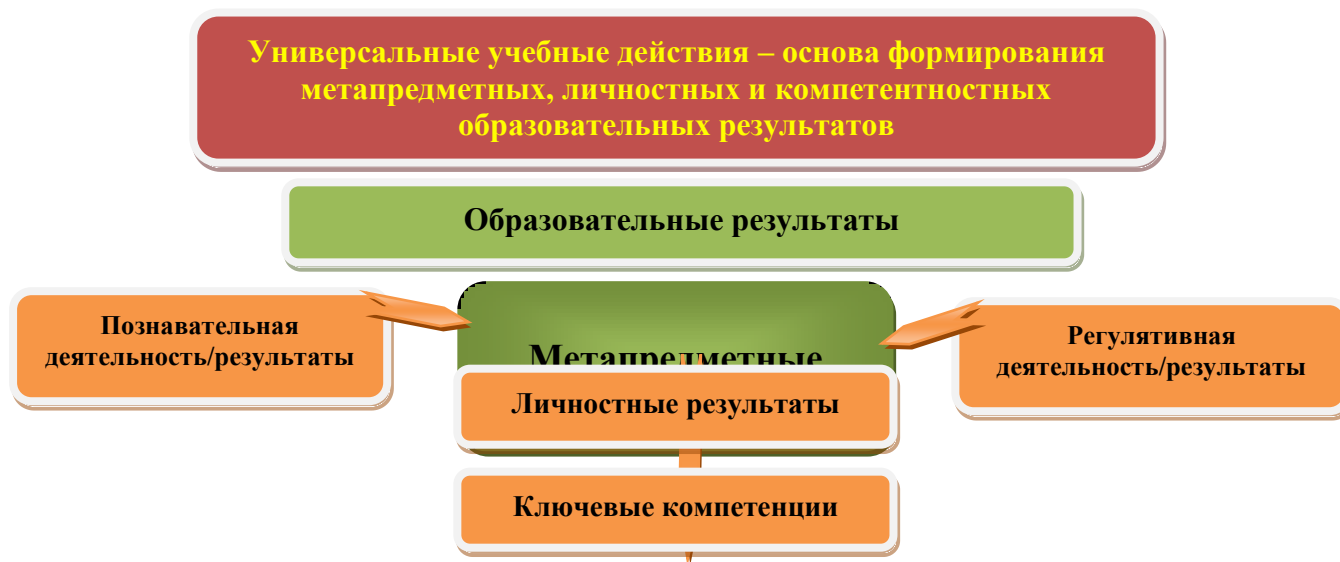
Рис. 3. Система оценки образовательных результатов

В процессе оценки используются разнообразные методы и формы, взаимно дополняющие друг друга (стандартизированные письменные и устные работы, проекты, практические работы, творческие работы, самоанализ и самооценка, наблюдения и др.).